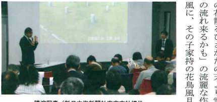
講演写真/新日本海新聞社東京支社提供

初めは、鳥取県ゆかりの万葉歌人として、大感激しました。憶良は、瓜食めば子と思ほゆ、栗食めば子と思ほゆ、も夜も頭を離れず、「銀も金も玉も何せむに勝れる宝子に及かめども」と詠み、絶賛しています。もう一つの魅力は誠実さで、貧窮問答歌「風交じり雨