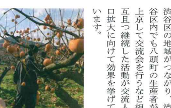
講演写真

鳥取県は現在交流人口拡大に向け、注力しています。私が応援している日本大学文学部部の国際交流ボランティアグループ「サラムント」は今年9月に鳥取県八頭町を16名が訪問しました。訪問は6年目になります。八頭町では花卉やタマネギの出荷作業や生産者との交流、栽培施設等の視察を行いました。昨年は