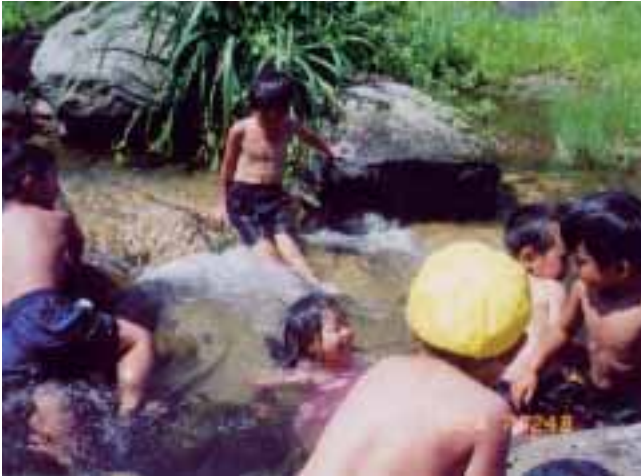
▲ 幼稚園のすぐそばを流れる河内川は、自然のプールです。ふるさとの自然の中で、心もからだも解放して思い切り遊びを楽しみました。 (鹿野町立小鷲河幼稚園)