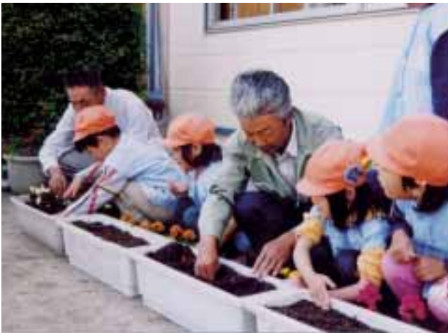
▲地域のおじいさん、おばあさんに花植えを教わりました。秋には一緒に「ぼて茶」をいただく機会をもつなど、地域の人たちとの交流を大切にしています。 (倉吉市立高城保育園)