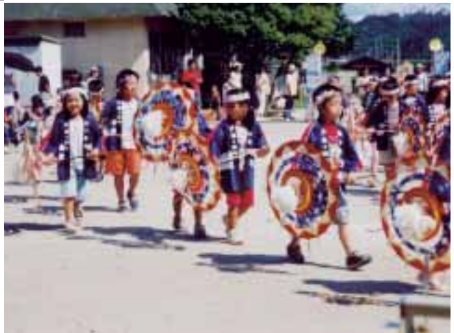
▲ 地域の方に作っていただいたふるさとの伝統工芸品「和傘」を使って踊ります。ふるさとの文化を身近に感じることができます。 (淀江町立淀江幼稚園)