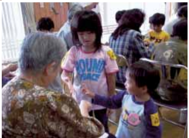
▲ 敬老会で、ダンスを披露した後、一緒に手遊びを楽しみました。おじいさんやおばあさんのやさしさに触れるとともに、喜んで迎えてくださる姿を見て、幼児にとっても役に立つ喜びを感じる体験となりました。 (羽合町立羽合幼稚園)