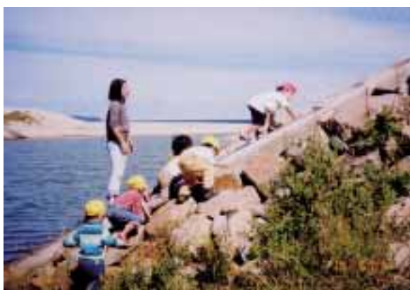
近くの加茂新川の河原で探検遊びをしました。園内では経験できない自然と触れ合う遊びを十分に楽しめます。 (米子市・米子幼稚園)