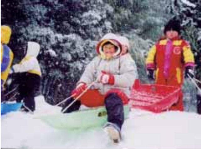
▲小学校のスキー場で、小学生と一緒に雪遊びを楽しみます。雪深い地域の特色を活かして、冬の遊びを十分に体験します。 (日南町立阿毘縁幼稚園・山上幼稚園・大宮幼稚園)