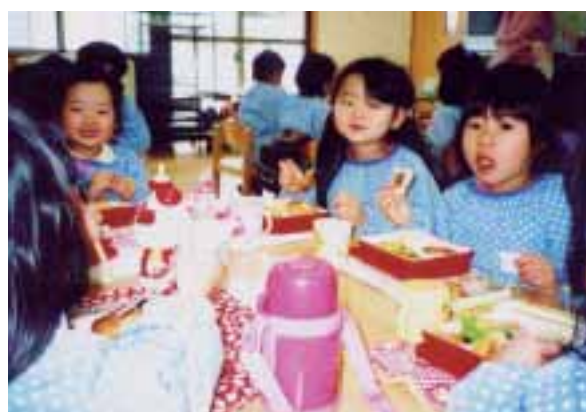
楽しい雰囲気の中で、好き嫌いなく食べることの大切さ、箸の持ち方、調理して下さる方への感謝の気持ちを学びます。 (米子市・米子みどり幼稚園)