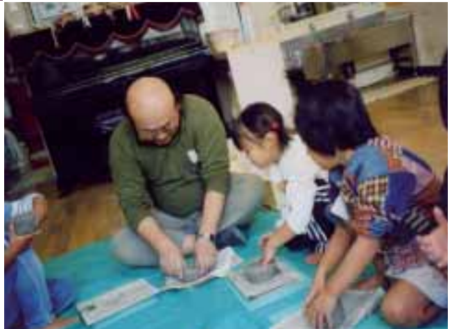
▲近所にお住まいの陶芸家を招いて一人一人が自分用のお茶会の茶碗を作りました。本格的な陶芸品づくりを通して地域の文化にも触れる活動です。 (倉吉市・向山保育園)