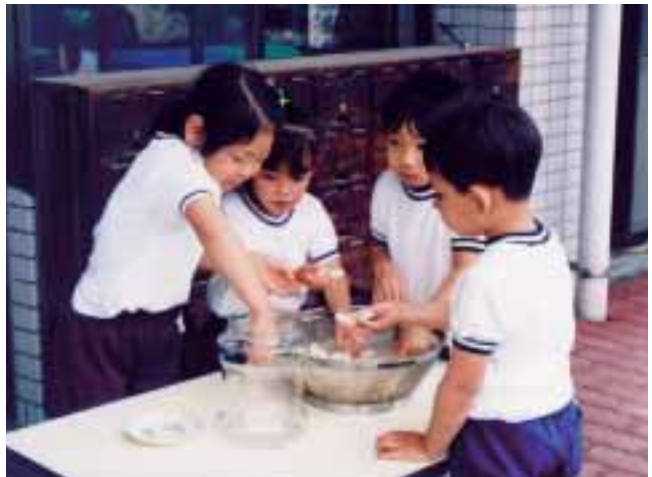
▲地域の方からいただいた特産物のらっきょうを漬けます。自分たちで漬けたらっきょうは、最高の味がします。 (福部村立福部幼稚園)