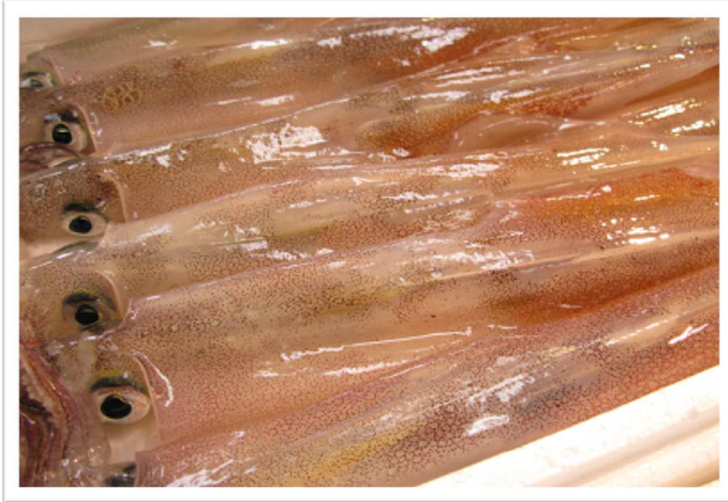
「子持ちイカ」の代表格。冬の真子（卵巣）は絶品。