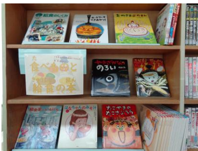
【図書館の特設コーナー】