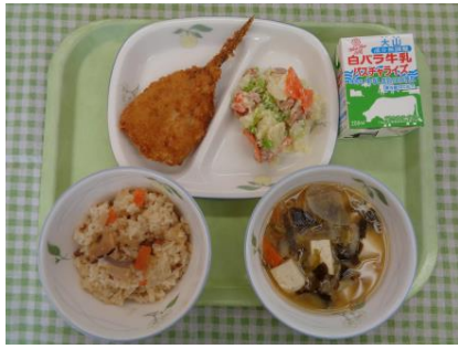
【中学校2年生作成献立】