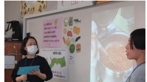
【給食時間における指導】

地域の一員として、地域をよくするために自分が出来ることは何かを考えることをねらいとして、町の小中学校出身の若手調理員と栄養教諭が連携して作成した献立を、「とっとり県民の日」の給食として実施した。当日は調理員が給食時間に浦安小学校6年生を訪れ、「幼少期から料理が好きで、食に関わる仕事に就いた。」「地元の子どもの成長を支える給食の仕事に、やりがいを感じている。」など、仕事や地域に対する思いを話してもらった。また、栄養教諭からは、「自分なりの地域貢献のあり方について考える機会にしてほしい。」と、将来の職業選択のみならず、今の自分が地域のために実践出来ることについて考える機会としてほしい旨を伝えた。