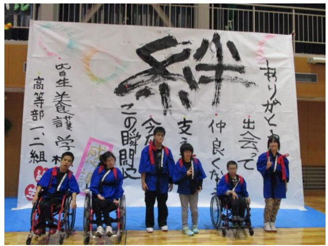
【書道パフォーマンス】