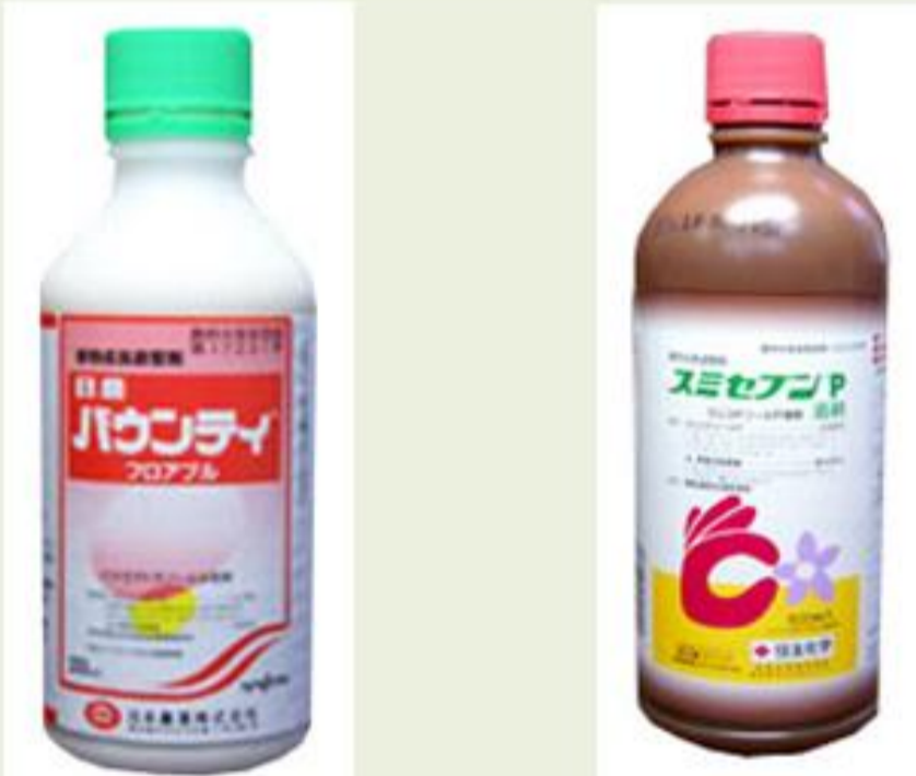
ジベレリン生合成阻害を有効成分とする植物成長調整剤