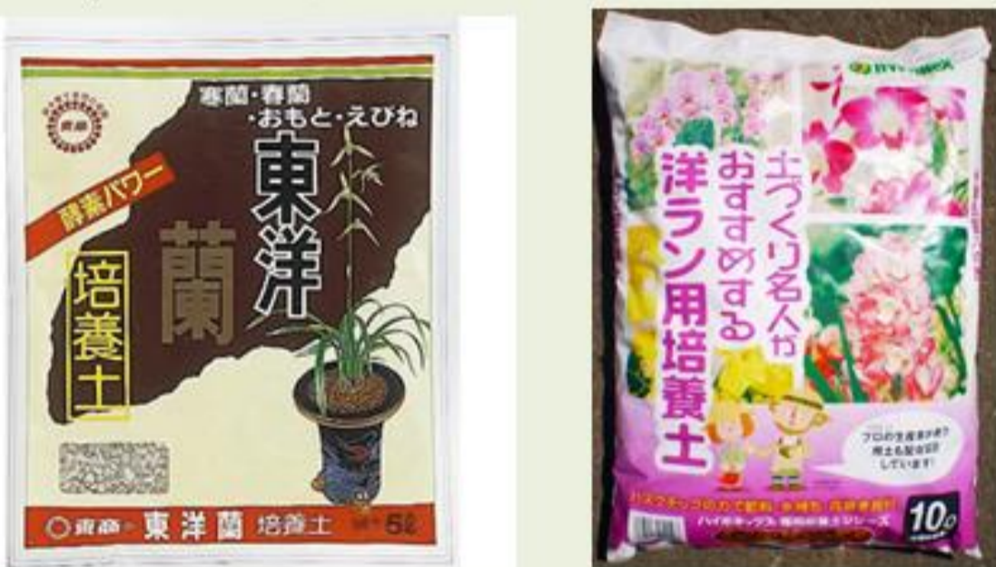
ラン栽培用培養土