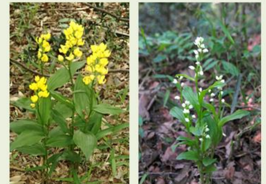
希少価値が高く贈答用として人気の高いキンラン・ギンラン