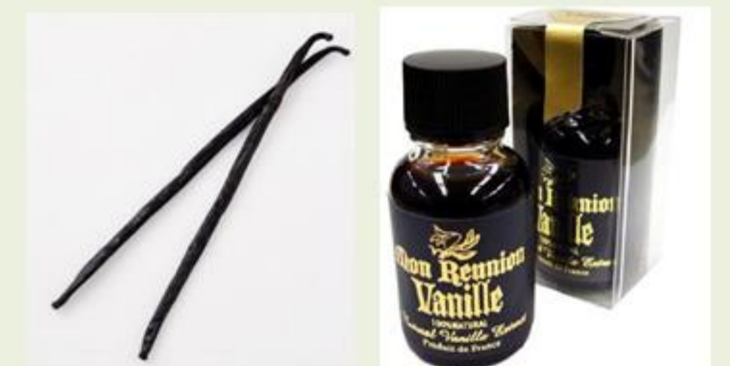
人工発芽が非常に困難なバニラ