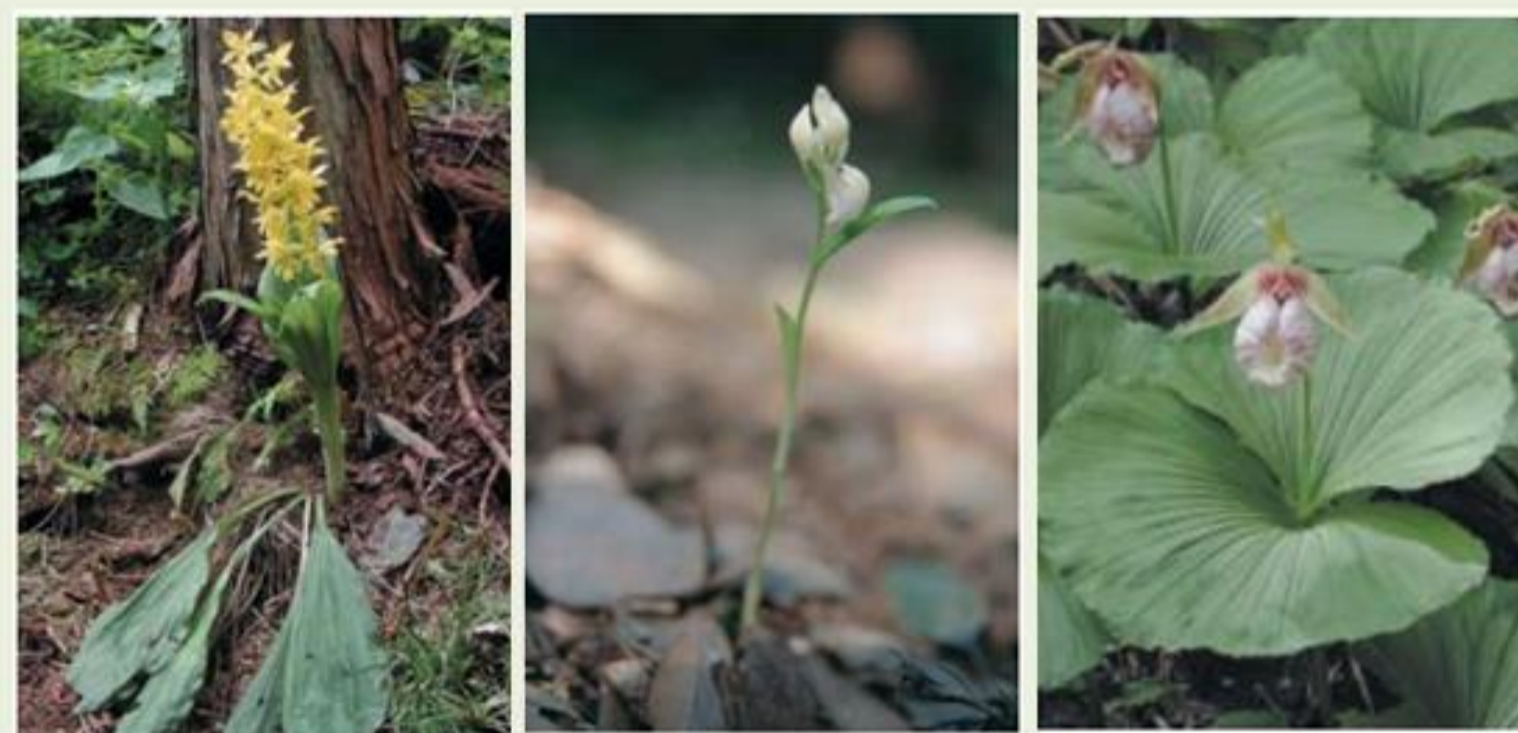
鳥取県で絶滅危惧種 I 類に指定されているラン科植物の例