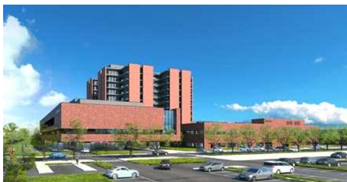
※新病院完成予定図