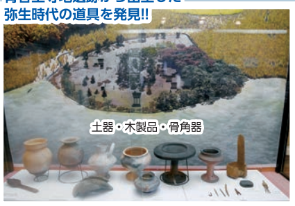
土器・木製品・骨角器