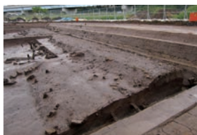
古代山陰道と現在の山陰道

現在の高速道路（山陰道）の付近で奈良時代の古代の官道（現在の高速道路にあたるもの）が見つかっています。この古代の官道は、都から山陰地方の国々をつなぐ「古代山陰道」と考えられています。青谷上寺地遺跡の「古代山陰道」のようにしっかりと古代の官道が残っていることとても珍しいということでした。また、同じところに古代と現在の高速道路があるのはおもしろいと思いました。