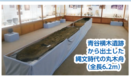
青谷横木遺跡 から出土した 縄文時代の丸木舟 (全長6.2m)