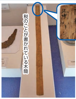
奈良時代の木筒（もっかん） ※古代の文字資料