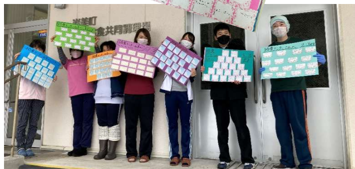
【給食センター職員のみなさん】