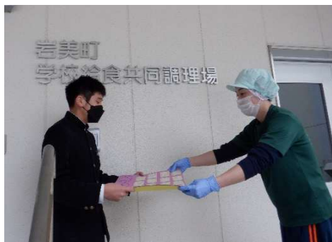
【メッセージカードの贈呈の様子】