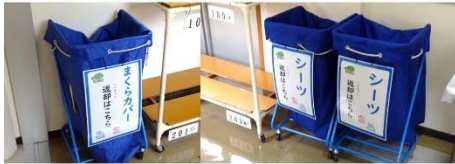
【まくらカバー】 【シーツ】