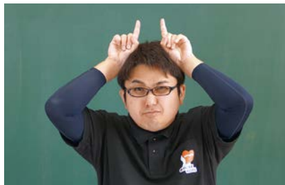
りょうて ひと ゆび あたま まえ た 両手の人さし指を頭の前で立てます。