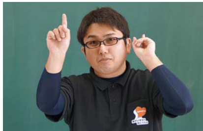
りょうて ひと ゆび かお たか てんじょう む の みぎて かお 両手の人さし指を顔の高さで天井に向けて伸ばします。右手は顔より まえ ひだりて ひだりみみ ちか お つぎ ひだりて みぎて い ち 前に、左手は左耳の近くに置きます。次に、左手と右手の位置を2～ かいぎやく 3回逆にします。