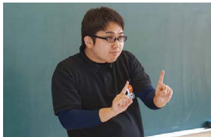
つぎ りょうて ひと ゆび ぜんご お 次に、両手の人さし指を前後に置き、追いかけているように前に動