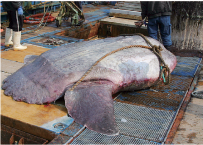
図8. マンボウ♀ 2007年11月15日 島根県隠岐海峡 (混獲)