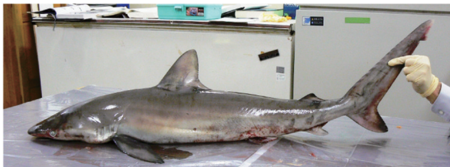
図12. スミツキザメ♀ 2006年5月30日 兵庫県新温泉町釜屋沖 (混獲)