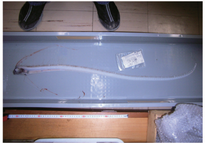
図10. リュウグウノツカイ 2006年5月28日 兵庫県新温泉町釜屋沖 (混獲)