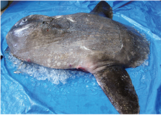
図7. マンボウ 2007年7月24日 鳥取県琴浦町赤碓沖 (混獲)