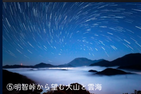
⑥明智峠から望む大山と雲海