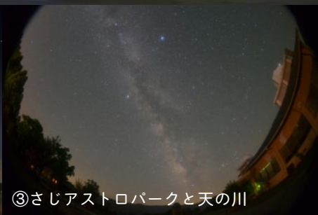
③さじアストロパークと天の川