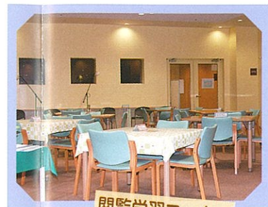
閲覧学習コーナー