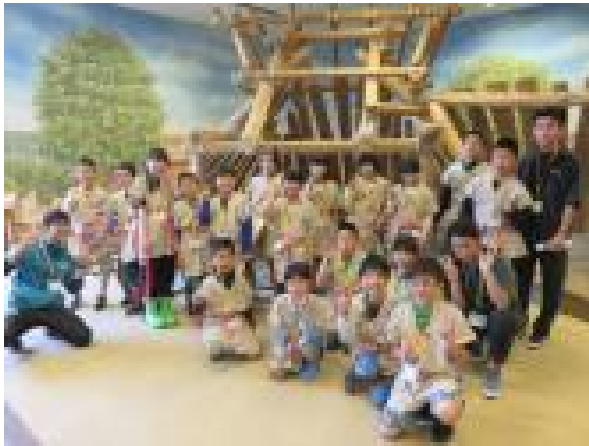
弥生時代の衣服である貫頭衣 かんとうい を来た 本年度の参加者