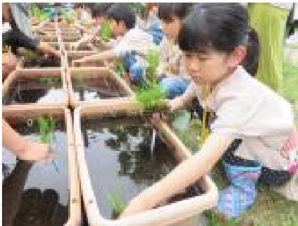
古代米である赤米、黒米の田植え