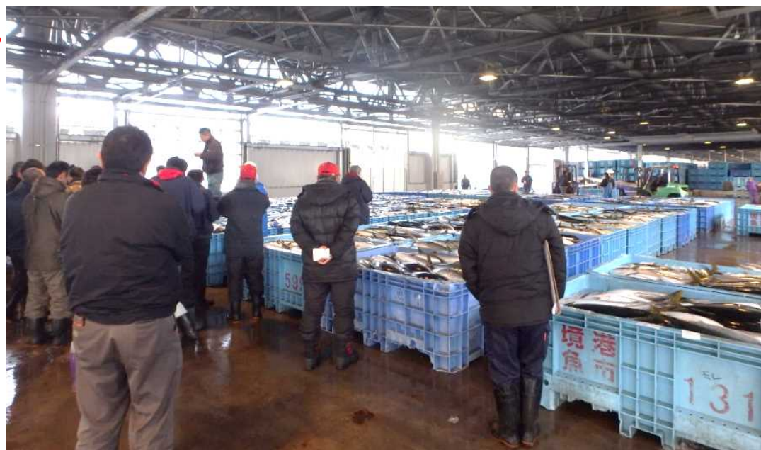
3号仮設荷さばき所で行われたハマチの入札。 荷受けの威勢の良い声が響きました。