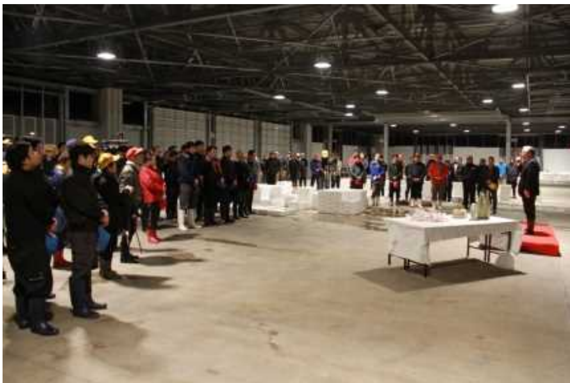
3号仮設荷さばき所での初セリ式(H29.1.5)。 荷受け、仲買等多くの市場関係者へのお披露目の場となりました。