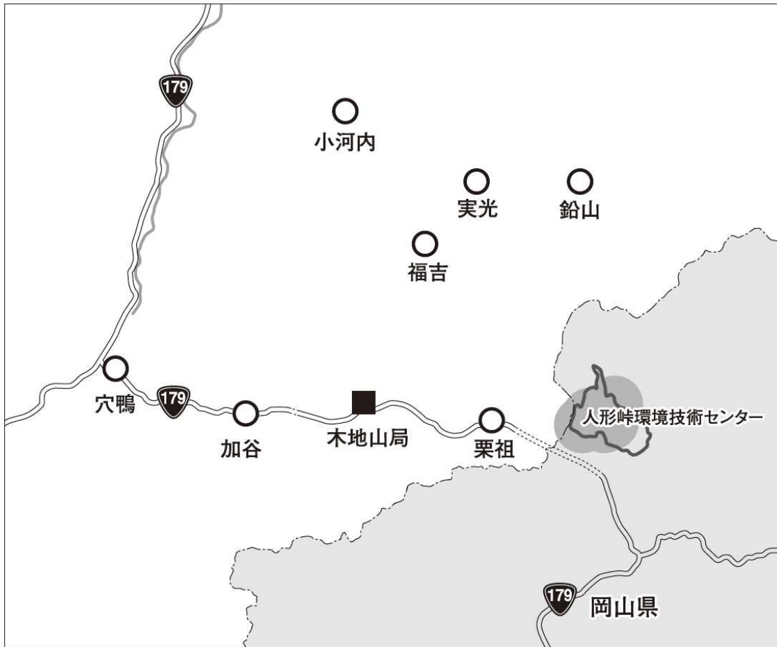
図3-2 モニタリング地点（詳細）