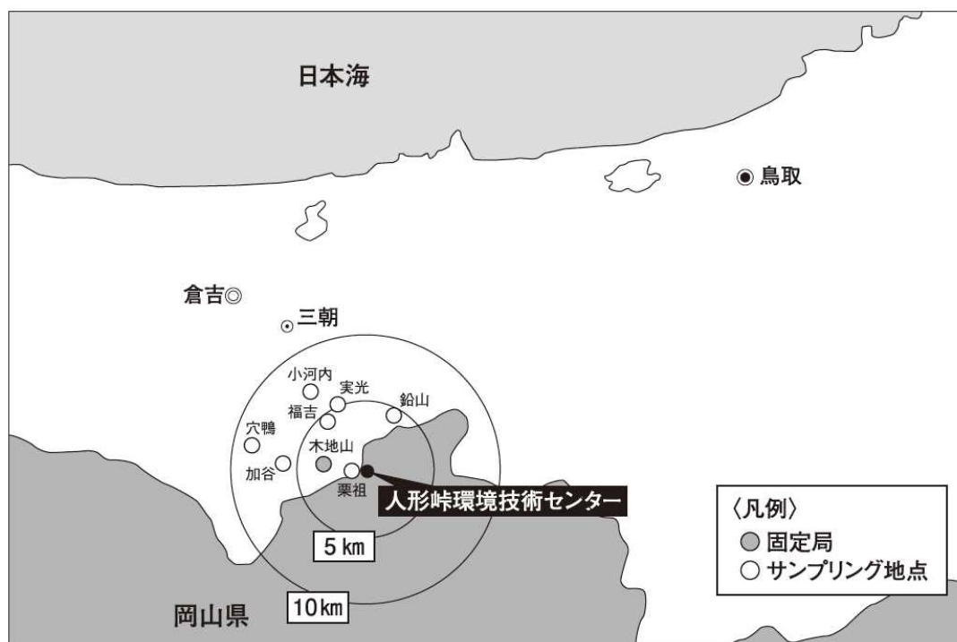
図 3-1 モニタリング地点