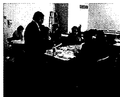
人材戦略・労務改善をテーマとした講座

○本事業のセミナー参加をきっかけに生産性向上や労務環境の改善に取り組むことの必要性を強く認識。専門家派遣による支援を受けながら、スキルマップ(業務に必要なスキルと従業員が有するスキルを一覧表にしたもの)を活用した人事評価・育成制度の来年4月の導入を目指し、現在、職員のスキル評価やキャリアアッププラン作成に取り組んでいる。