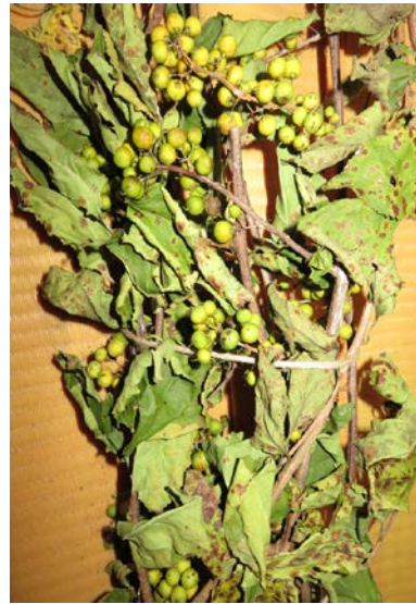
④自然乾燥 84～96 時間