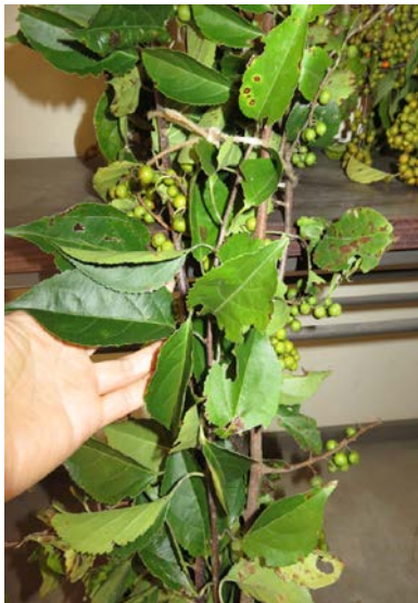
①自然乾燥 0～24 時間