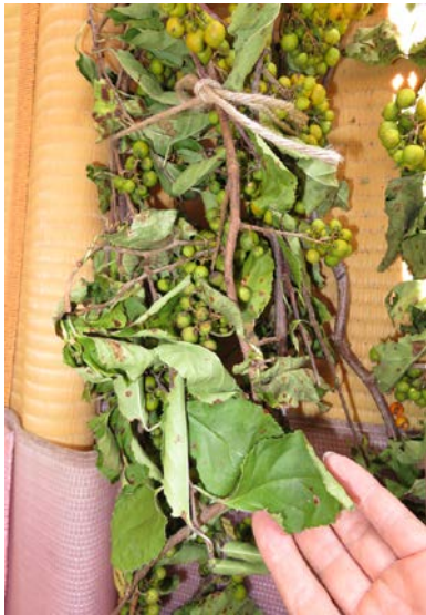
③自然乾燥 60～72 時間