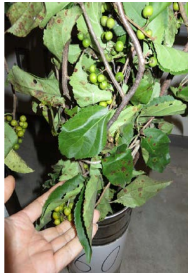
②自然乾燥 36～48 時間