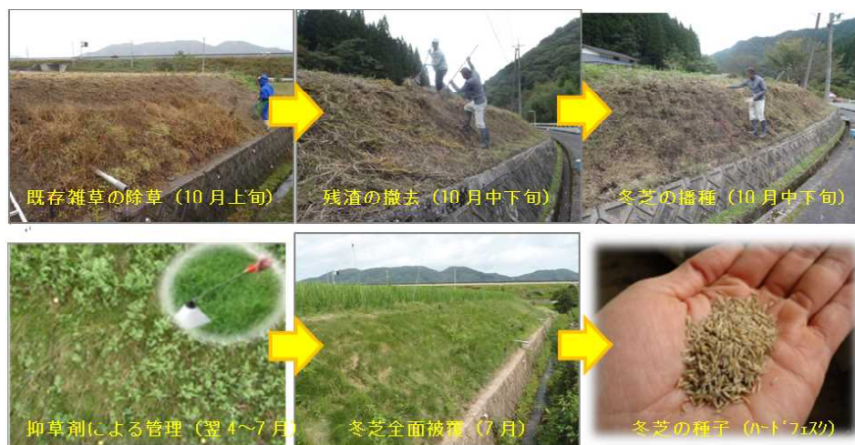
図1 冬芝の植栽手順

冬芝の植生転換にかかる資材費は、畦畔法面 1000 m 2 当たり、芝種子 35 千円（15kg 程度）、除草剤及び抑草剤 12 千円の合計 47 千円程度である。12 時間程度の作業で、専用機器を使わず自力導入が可能である（表1）。