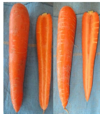
写真 左から ‘ベーター312’、‘愛紅’

‘愛紅’ は、‘ベーター312’ と比較して尻づまりは同程度に優れ、形状はやや肩張り、芯色は淡い。搾汁液の糖度は ‘ベーター312’ よりも高いが、食味アンケート（11月）ではニンジン臭が感じられた（表2）。