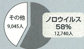
原因別の食中毒患者数(年間)