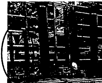
（写真①：中庭側の開閉式ドア）