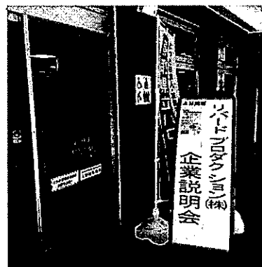
○企業説明会 (H30年8月/鳥取HW)