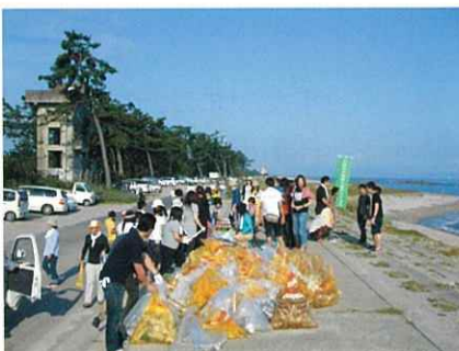
たくさんのゴミが集まった