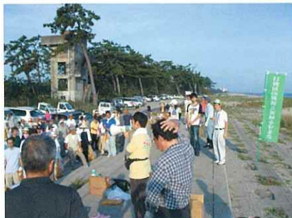
たくさんの人が集まった

日吉津海岸クリーン作戦実行委員会が主催される美しい日野川の最下流となる日吉津海岸を清掃するボランティア活動に参加しました。約600名の参加者が清掃に汗を流しました。以前より少なくなつたとはいえ、たくさんのゴミが集まりました。