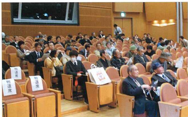
▲熱心に聞き入る会員の皆さん