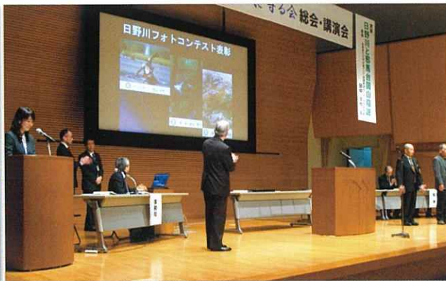
▲日野川フォトコンテスト表彰式