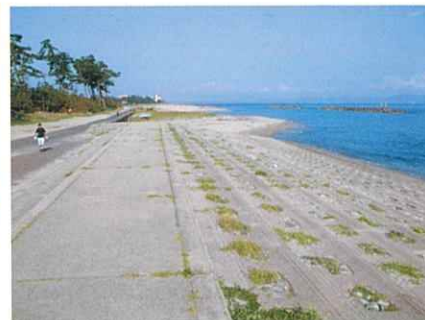
きれいになった美しい日吉津海岸