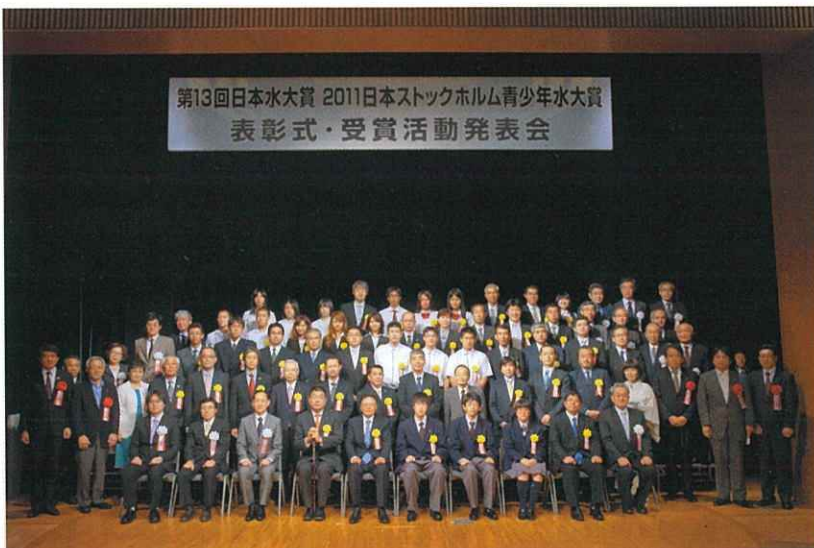
▲式典参加者全員の記念写真

水供給者が熱意と誇りをもって主導し、日野川流域圏の様々な主体の連携を実現して、水循環健全化の活動を進めていくことが高く評価されます。