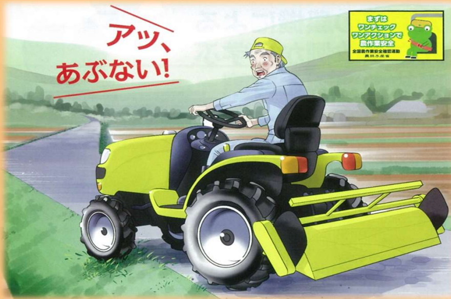
令和3年度に県内で発生した農作業中の重大事故(11月末現在)