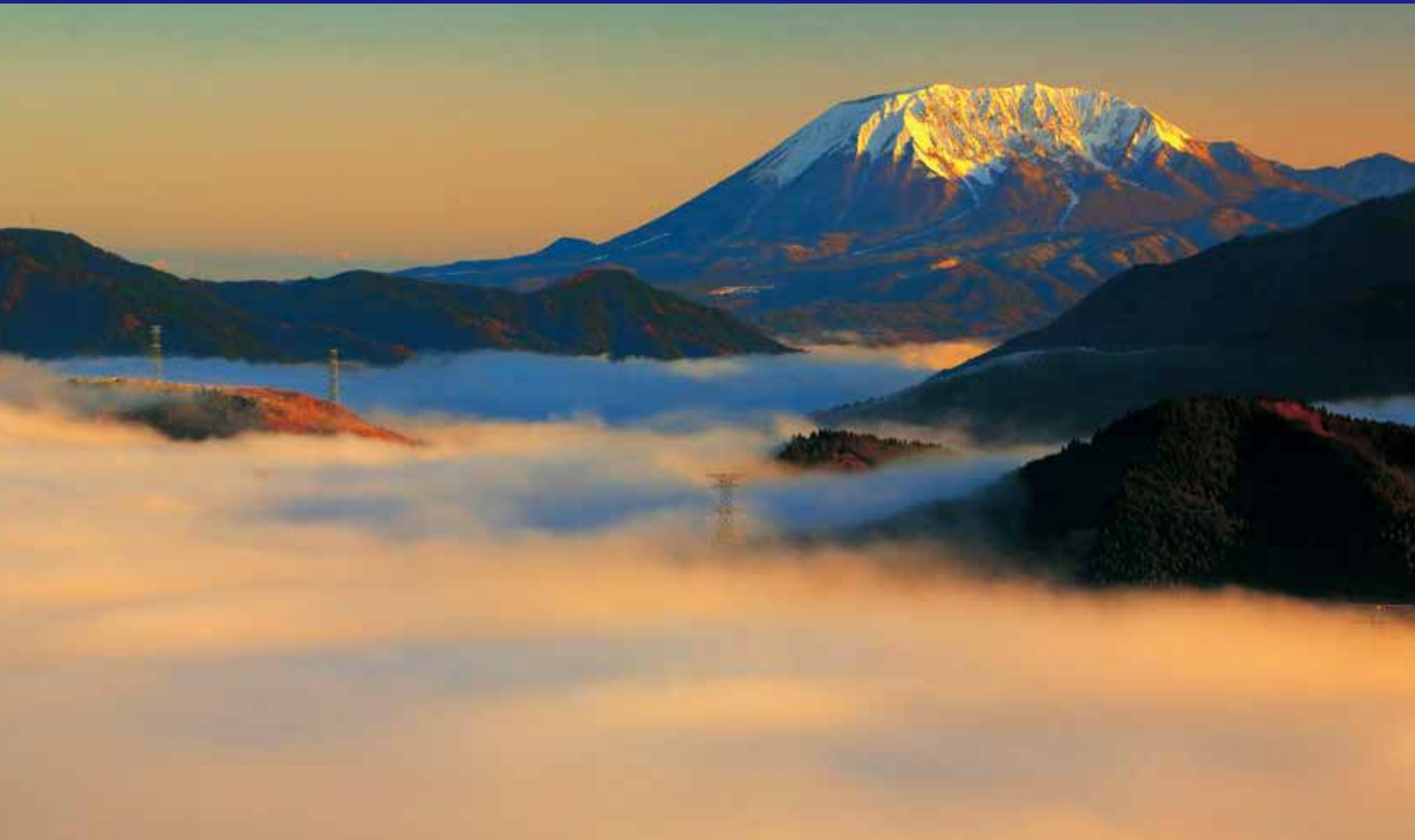
日野町・明地峠からの雲海と大山南壁