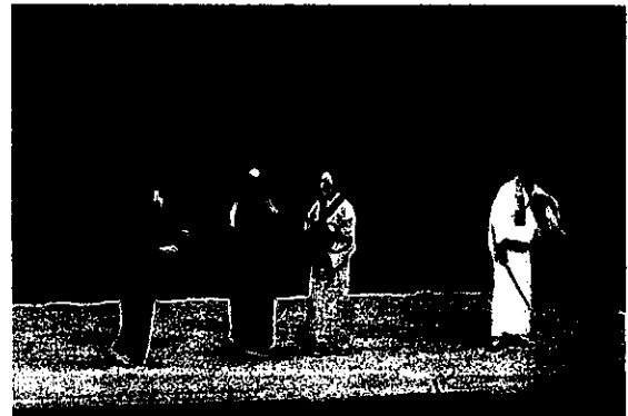
暴力追放時代劇「親子しぐれ」