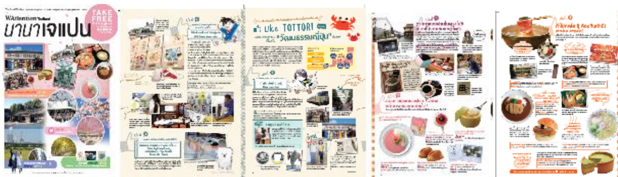
WAttention Thailand 2月号

タイ人に人気の日本の観光情報・文化を紹介するフリーペーパー「WAttention Thailand」内で、鳥取県の魅力を5月号、8月号、11月号、2月号と年4回に渡って紹介しました。鳥取へタイ人・日本人スタッフが取材に行き、タイ人目線で鳥取の観光の楽しさをPRしました。掲載された記事をまとめて鳥取観光パンフレット作成し、旅行博での配布や旅行会社から問い合わせが会った際の説明などに活用しています。