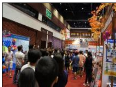
じゃんけん待ちの行列（大混雑）