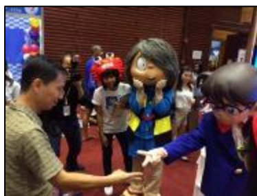
コナンとじゃんけん

昨年7月と今年2月に開催されたタイ国際旅行フェア（Thai International Travel Fair）、昨年11月に開催された個人旅行促進を目的とした訪日旅行フェア「Visit Japan F. I. T. Travel Fair2016Winter」で鳥取県としてブースを出展し、日本に興味があるタイ人来場者に鳥取県の観光地を紹介しました。7月のタイ国際旅行フェアではコナンや鬼太郎も登場し、来場者とのじゃんけん大会で大いに盛り上がりました。ブースを訪れた来場者からは「鳥取はどこにあるの?」「コナン博物館に行ってみたい!」「鳥取県内を効率よく回るルートを教えて欲しい」などの問い合わせが数多く集まり、観光地としての鳥取県の知名度・関心度が高まっていることを感じました。