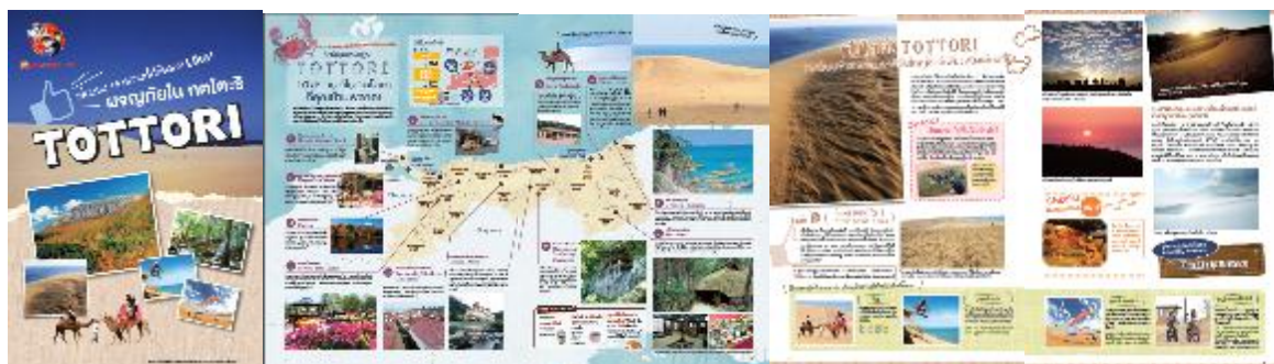
鳥取観光パンフレット