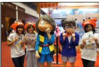
ブースサポートスタッフ