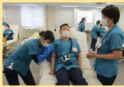
安楽な体位を実践・実感しました