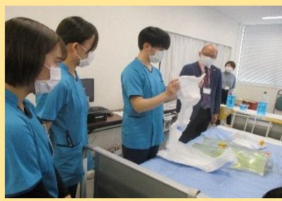
おしめフィッティングのコツを学びました