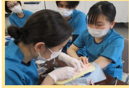
緊張の瞬間! 逆流確認・しびれの確認...