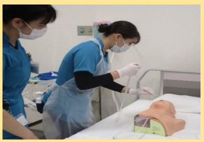
素早く丁寧に声をかけながら吸引します