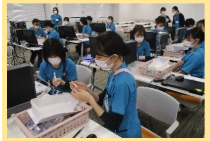
患者認証の基本を守って行います