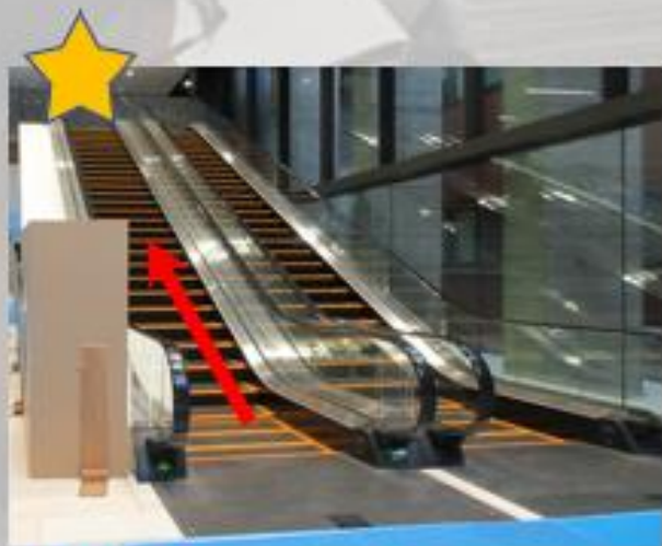
外来中央エスカレーター