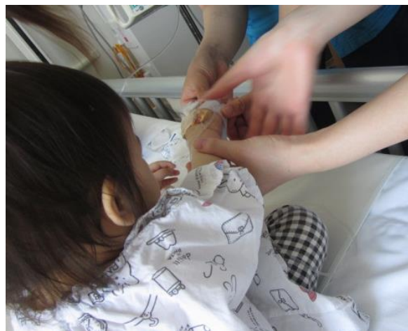
点滴の固定チェック