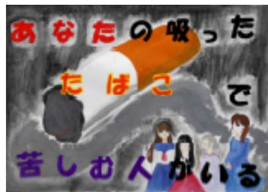
※県内禁煙イベント受賞作品