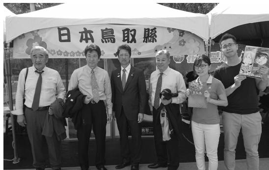
鳥取県観光PRブースのスタッフの方との記念撮影