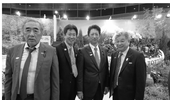
台中フローラ世界博覧会の施設内視察の様子