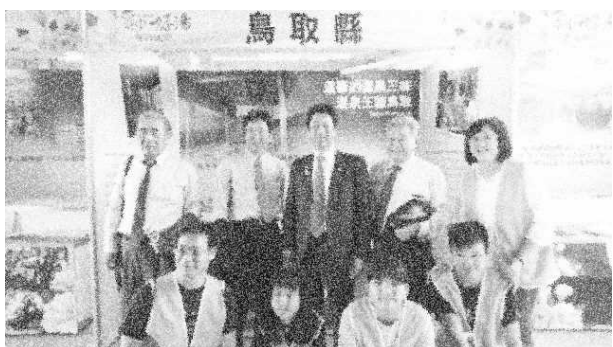
台中市立石岡国民中学の皆さんとの記念撮影