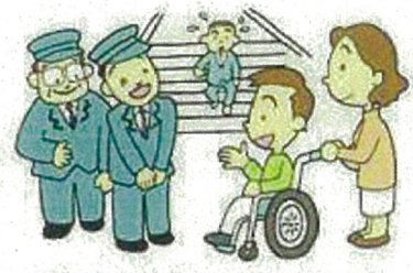
周りの人たちと協力しましょう。