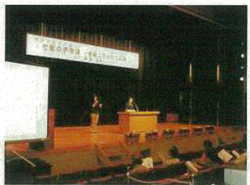
誰もが参加しやすい講演会(要約筆記・手話)