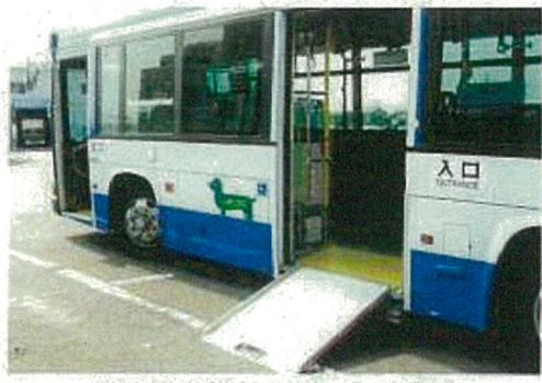
乗り降りが楽なノンステップバス

まちの中や普段何気なく使っているものにもユニバーサルデザインがいっぱい。 みんなが公平に使える、みんなにわかりやすい、みんなが楽に使える、使いやすい方を選べるなど、思いやりを形にしたユニバーサルデザインの一例を紹介します。