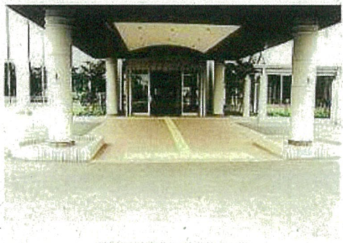
段差のない出入り口