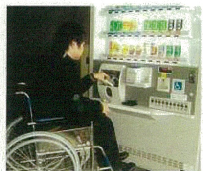
商品が取り出しやすい自動販売機