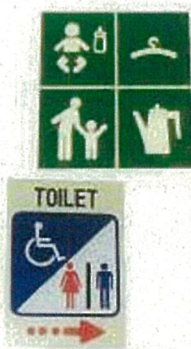
わかりやすい標示