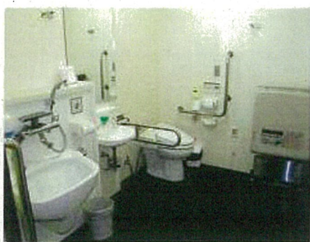
誰もが利用しやすい多目的トイレ