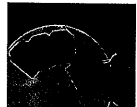
猪皮のお守り入れ

また、亥年にちなんだノベルティ（猪の皮革を使ったお守り入れ、県内子ども園児による猪の絵柄のカレンダー）などが当たる抽選会も開催しました。