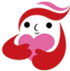
犯罪被害者等支援 シンボルマーク ギュuttoちゃん