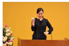
開会式でのおことば