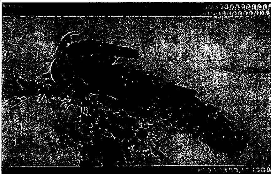
1 土方稻嶺 《牡丹孔雀図》