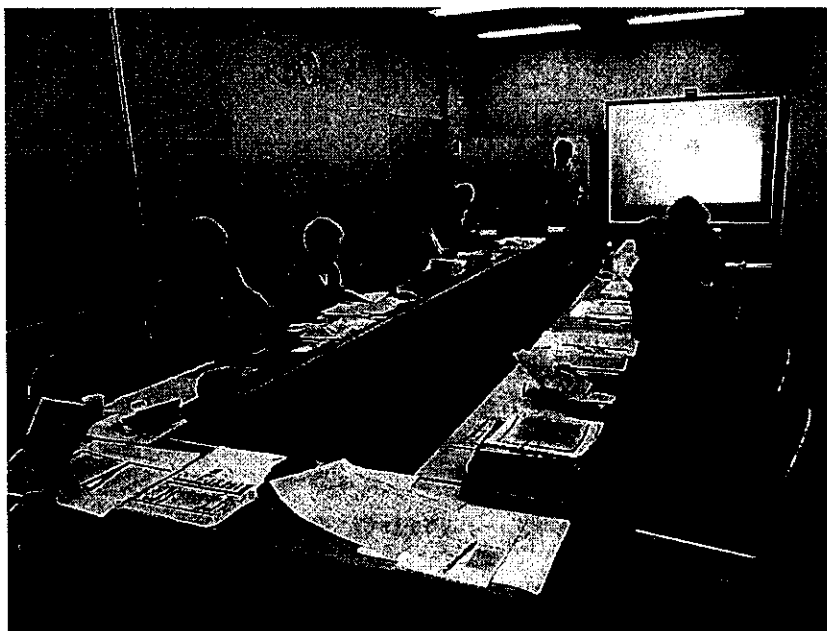
平成 30 年度の活動の様子 (鳥取市歴史博物館地下研修室)