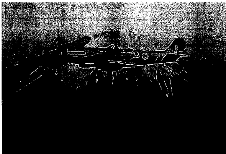
美保基地を拠点に日本海沿岸の密航監視飛行を行ったイギリス連邦空軍機 Spitfire。背景は冠雪の大山。(BCON 英連邦軍新聞 1946. 12. 28 付 国会図書館所蔵)