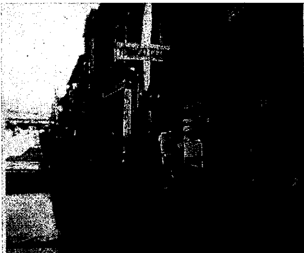
占領期の米子駅前。進駐軍士官飲食店 YONAGO CLUB の看板が見える。