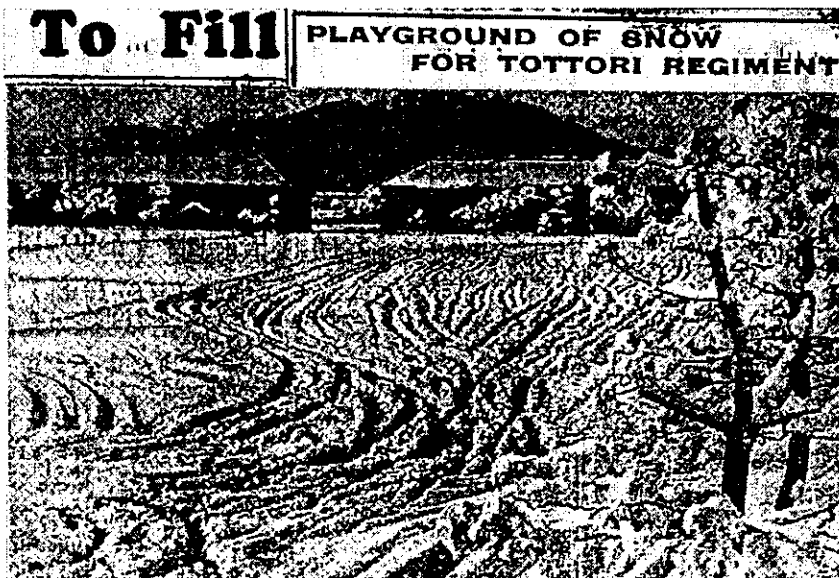
雪に覆われた鳥取連隊練兵場