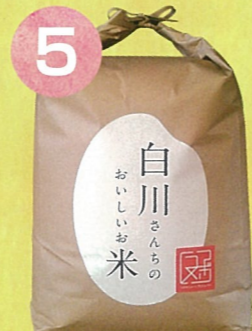
5 鳥取西いなば産 コシヒカリ白米9kg

※写真はイメージです。※賞品は、色や柄が異なる場合や、予告なく変更する場合があります。