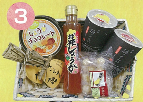
3 鳥取西いなば生姜セット