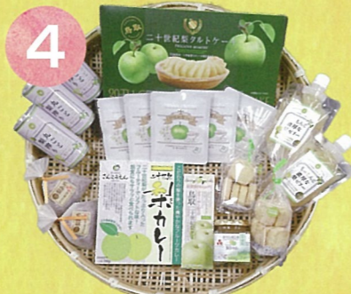
4 二十世紀梨セット