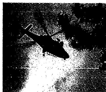
ヘリによる遭難者のつり上げ