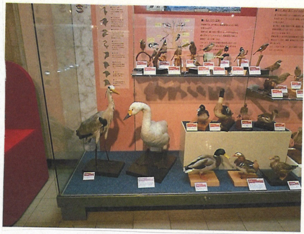
身の回りでよく見る 鳥の生体がいっぱい あります。