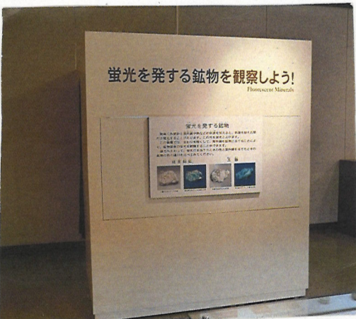
ブラックライトをあけると 鉱物が光ります。