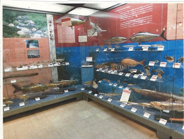
よく見る魚や珍しい魚がたくさん 展示されています。