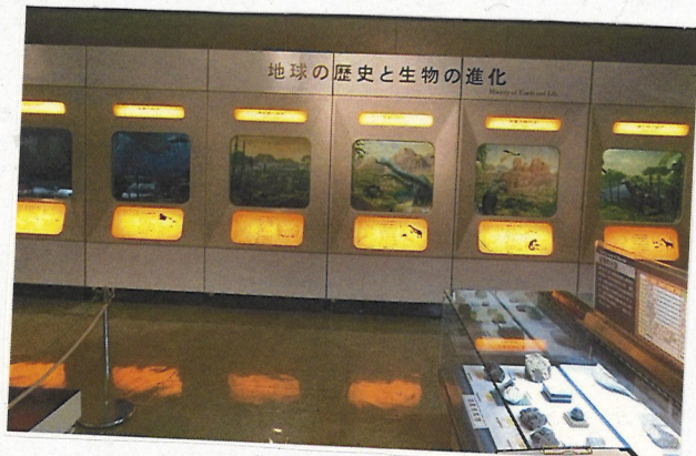
水中や地上の生物の 進化がわかりやすく まとまっています。