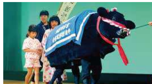
昨年のまつりで披露された高城牛追掛節(倉吉市)

○公演/鬼面太鼓(伯耆町)、伊勢大神楽(南部町)、 おお 逢 あ 東 あ 盆 あ 踊 あ り(琴浦町)、 きり 麒麟 りん 獅子舞(鳥取市)、泊 あ 貝 あ が あ ら あ 節(湯梨浜町)、白 はく 鳳 ほう 太鼓(琴浦町)