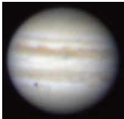
望遠鏡で見た木星