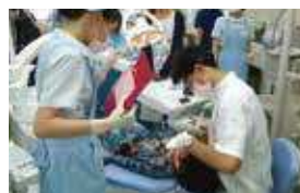
昨年の歯科検診の様子