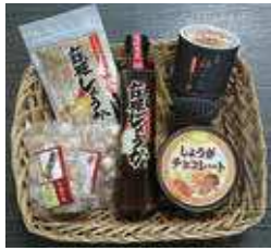
特産品は「因習和紙セット」「鳥取西いなば生姜セット(左写真)」「鳥取砂丘お菓子詰め合わせ」の中から1つ選べる