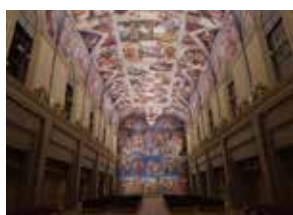
陶板名画美術館 二大塚国際美術館 (徳島県鳴門市)