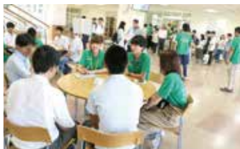
昨年度オープン キャンパスの様子 (学生と話そうコーナー)