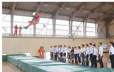
昨年度オープンキャンパスの様子(救助訓練)