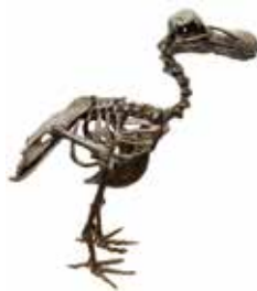
ドードー(骨格複製) 群馬県立自然史博物館蔵