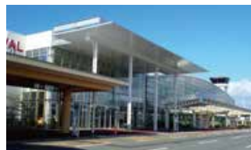
昨年7月28日に リニューアルした 鳥取砂丘コナン空港