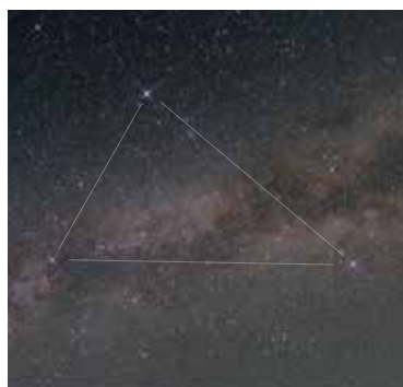
鳥取市佐治町で撮影された夏の大三角

7月は、3日が新月、9日は上弦(半月)、25日が下弦(半月)。1~6日と21~31日は星が見やすいです。また、今月から東の空に「夏の大三角」が見られるようになります。