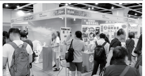
◎水木プロダクション◎パピエ・谷口ロー／小学館◎青山剛昌／小学館

まんがの知名度を活かして鳥取県をPRするため、昨年度に続き、香港最大規模の展示会である香港ブックフェア（期間：平成30年7月18日～24日）に出展しました。今回は、まんが王国とっり満喫周遊バスの販売促進をはじめ、「まんが王国とっり満喫周遊の旅」の魅力を提案し、本県への誘客を図りました。多くの香港の方を、見どころ満載の鳥取県でお見かけしたいですね。