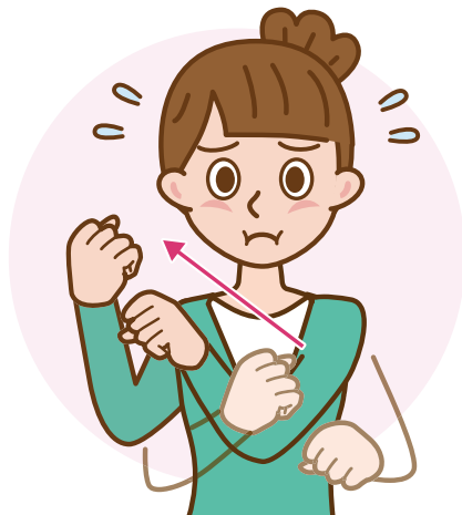
②両手を握り、左斜め下から 右上へ動かす