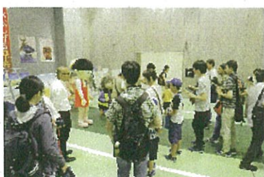
(鬼太郎、ねこ娘との記念撮影の様子)

また、駅弁の開発や沿線・車窓の景観整備などへの支援を行い「鳥鐵の旅」の魅力向上を一層進める。