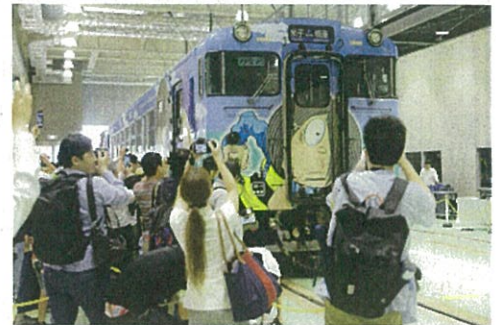
(記念セレモニーの様子(鬼太郎列車入線場面))