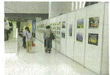
(写真展会場の様子)