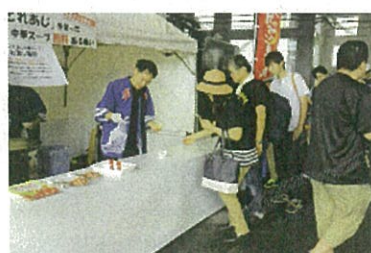
(とれとれあじの中華スープの試食の様子)