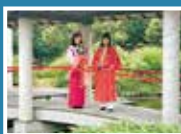
古代衣装の試着体験

万葉集、大伴家持、伊福吉部徳足比売に関する展示があり、古代因幡と万葉文化に触れることができる拠点。館内では万葉植物の庭園や古代衣装の試着体験も楽しめます。