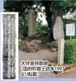
大伴家持歌碑 (国府町郷土読本1997より転載)