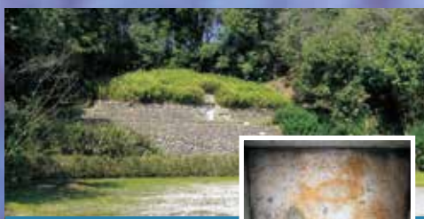
魚をモチーフにした壁画