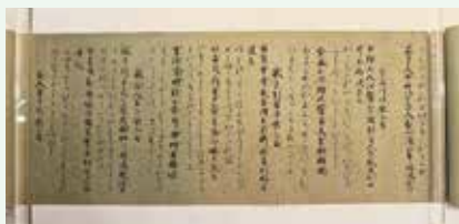
藍紙本万葉集（複製）

万葉集の発案者や作成の目的など詳しくわかっていませんが、万葉集に収められている歌の表現様式や種類にはさまざまな形があります。知っている、「万葉集」の面白さがより実感できます。